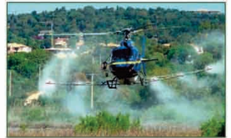
▲ Un hélicoptère pour la démoustication

Le Moustique Tigre est aussi compétent pour transmettre la dengue. Cependant, c'est l' Aedes aegypti le principal vecteur de cette maladie, mais il n'est pas présent en France : c'est l'Arbovirose la plus répandue dans le monde, elle tue 20 000 personnes par an. Selon l'OMS, le paludisme touche entre 300 et 500 millions de personnes par an, 1,5 à 2,7 millions décèdent. Près de 50 % ont moins de 5 ans.