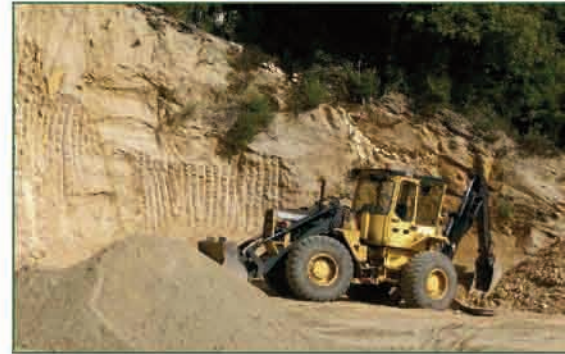
▲ Travaux de voirie sur la route départementale 420

Le territoire possède plus de 800 ponts dont la grande majorité sont des voûtes traditionnelles et l'autre partie des ponts en béton armé. Mais hélas, ils sont souvent vétustes. C'est pourquoi le Conseil