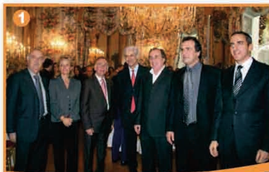
1. Réception des vœux de la nouvelle année dans les salons du Palais Lantivy, le 11 janvier 2008 .