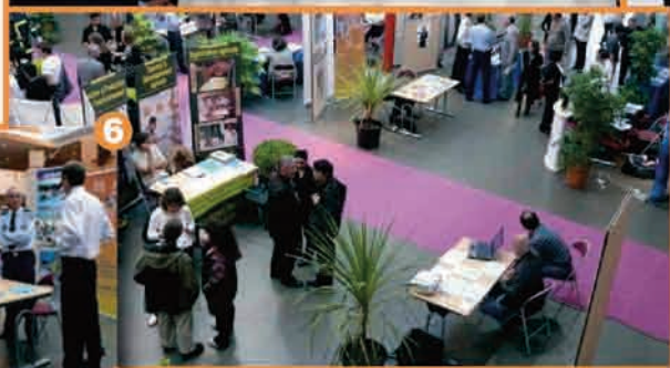
5. Visite ministérielle de Michèle Alliot-Marie.