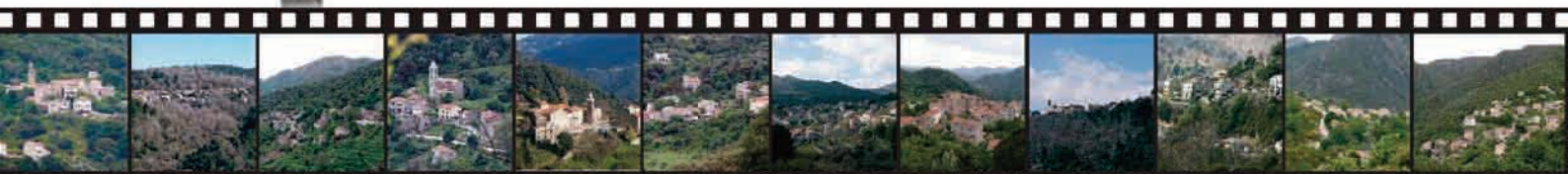
Altagène Aullène Cargiaca Loreto di Tallano Mela Olmiccia Quenza Sainte-Lucie de Tallano Serra di Scopamene Sorbollano Zerubia Zoza

Communes : Altagène, Aullène, Cargiaca, Loreto di Tallano, Mela, Olmiccia, Quenza, Sainte-Lucie de Tallano, Serra di Scopamene, Sorbollano, Zerubia, Zoza