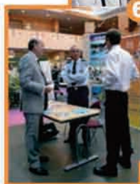
7. Inauguration de la tour de Campomoro, le 28 avril 2008 .