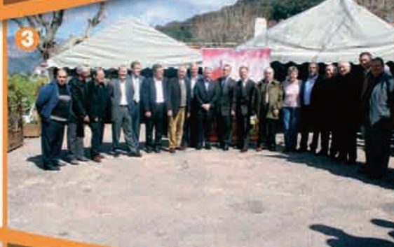
3. Foire de Sainte-Lucie de Tallano, les 29 et 30 mars 2008 .